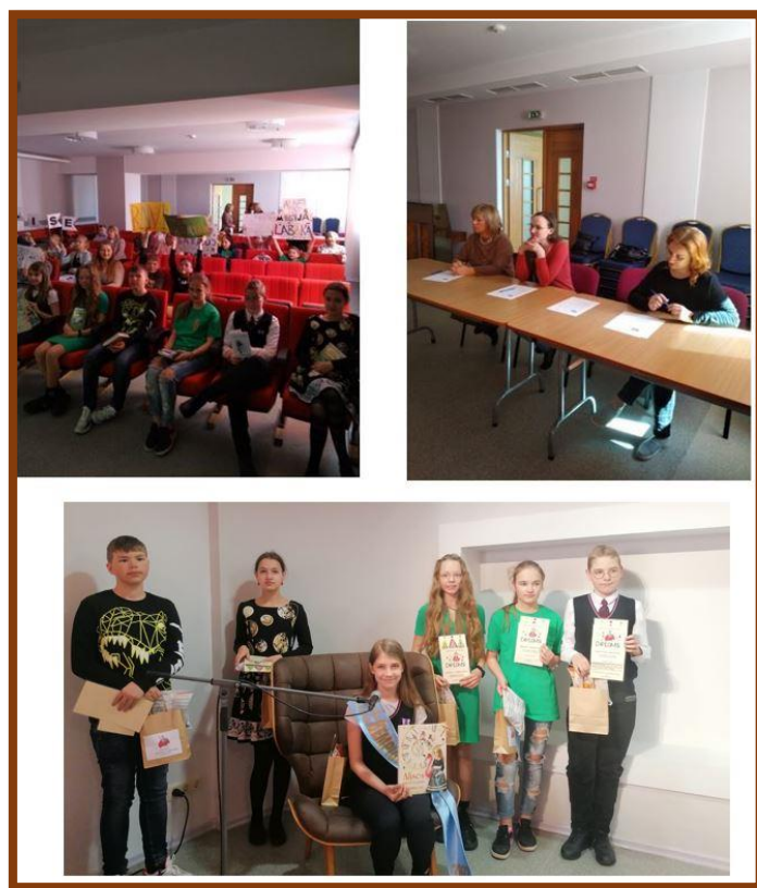
Foto no pasākuma