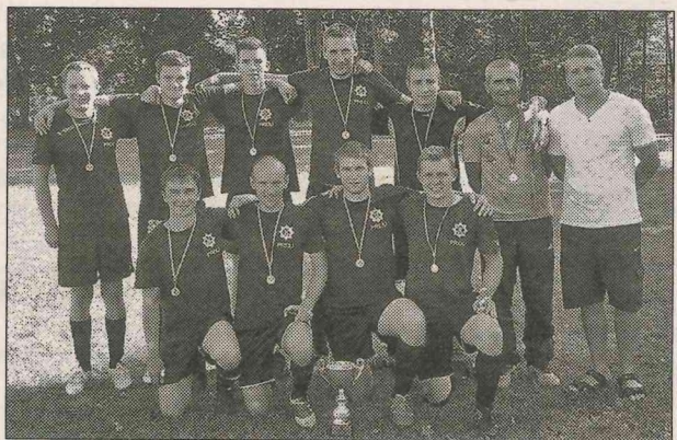
1. vietas ieguvēji – Preiļu VUGD