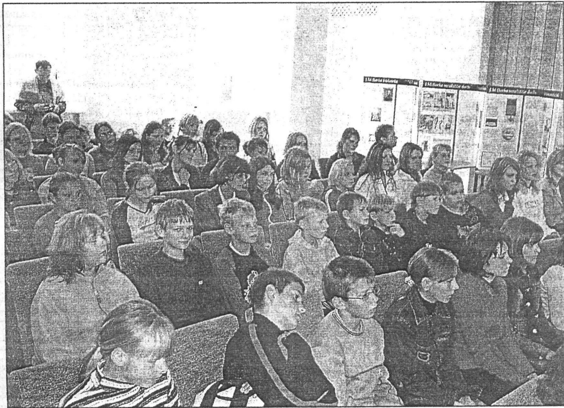
● Dzīvā vēstures stunda Preiļu skolēniem Eiropas kultūras mantojuma dienās.