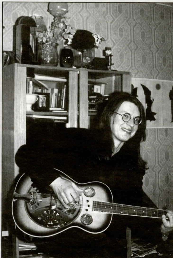
Juris un ģitāra.

– Jā un jā. Tik un tā man nākas pietiekami daudz sabiedrībā būt. To prasa mana darba specifika. Bet specifika