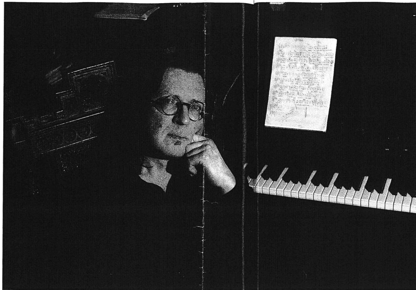
STRĀDĀ DZIESMU SVĒTKIEM. Dzimšanas dienu svinēt komponistam nebūs laika, viņš steidz pabeigt mūziku XIV Deju svētku lieluzvedumam