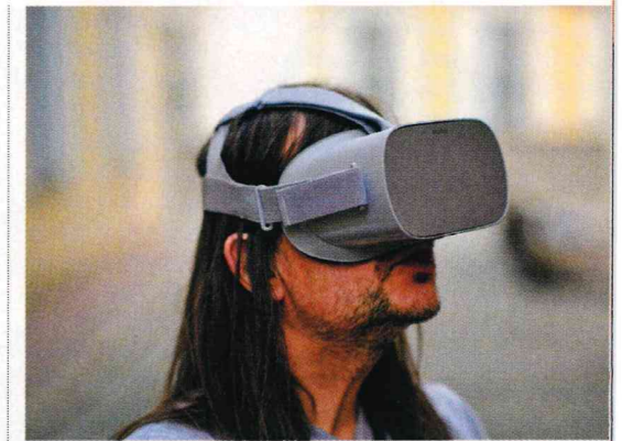
PASAULE BRILLĒS. Tiem, kuri netika noskatīties virtuālās realitātes filmas pirmizrādi uz pārpildītā Noasa , turpmāk būs iespēja to izdarīt LMT ( Latvijas Mobilais telefons ) klientu apkalpošanas centros