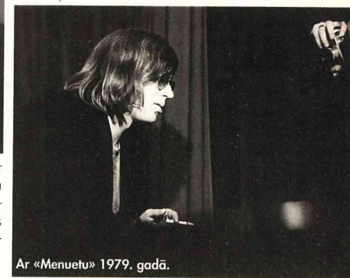
Ar «Menuetu» 1979. gadā.

– Njā... Hm... Interessants jautājums... Te var visādi. Te var pozēt un teikt, ka jā. Te var nepozēt un teikt, ka nē, jo esmu vienkāršs garīga darba proletāriets un man nav laika nodarbo-