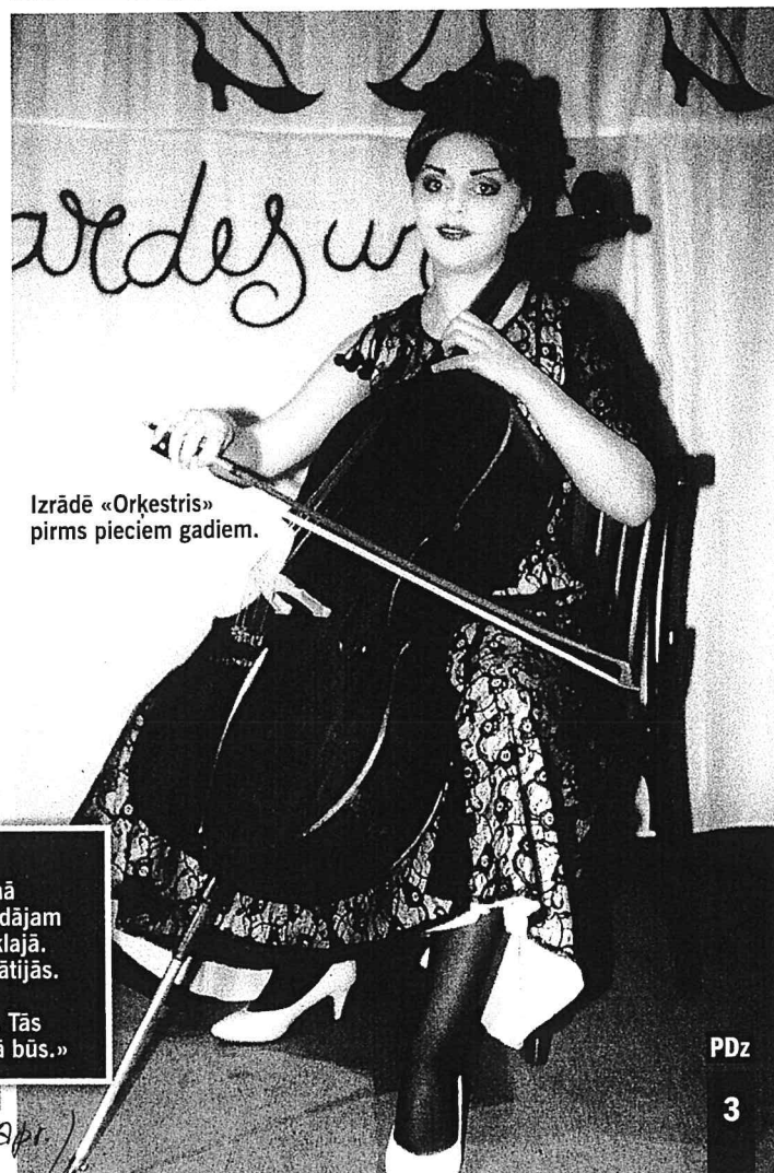
Izrādē «Orkestris» pirms pieciem gadiem.