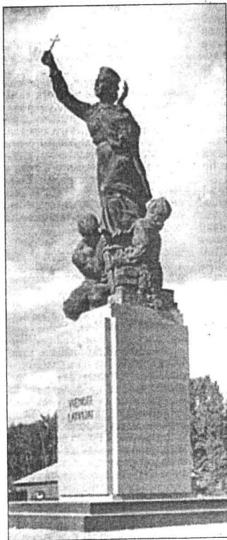
Скульптура «Латгальская Мара — едины для Латвии» — символ освобождения Латгалии, 1939 год.