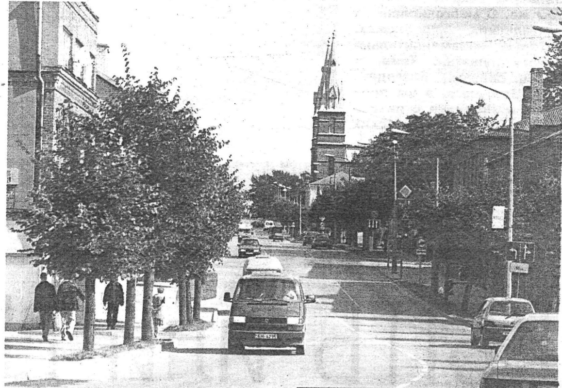
...а это — та же улица (см. стр. 5) в 2005 году.

отца заключалась в том, чтобы сначала создать автономию в составе России, а затем думать о возможности присоединения оккупированной Латвии к самостоятельной Латгалии. Напомним, Курземе и Земгале находились в