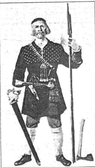
Латгалец времен Луочплесиса, так как медведь по-латгальски не lācis , а luocis .