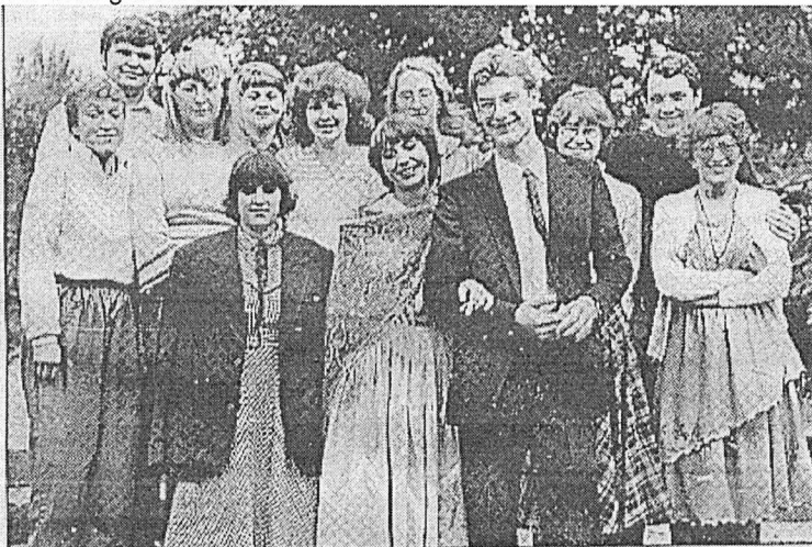
• Savā kāzu dienā 1983. gada 28. augusta Sēlpils skola.