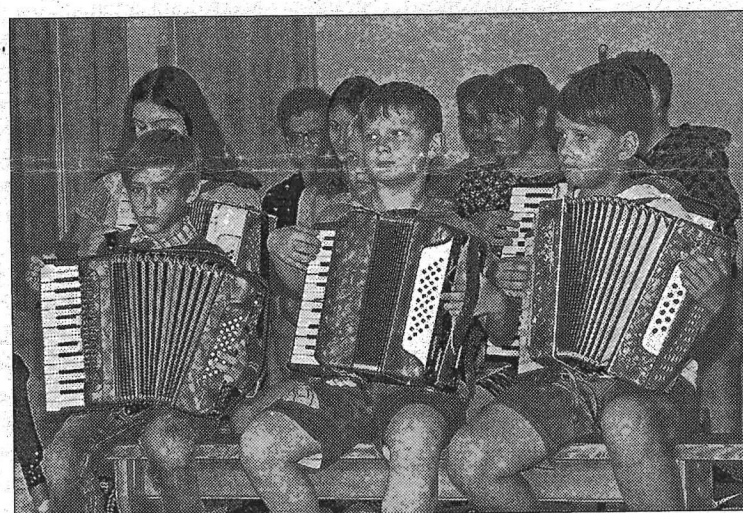
Nometnē «Garā pupa» bērni varēja apgūt arī dažādu mūzikas instrumentu spēles prasmi