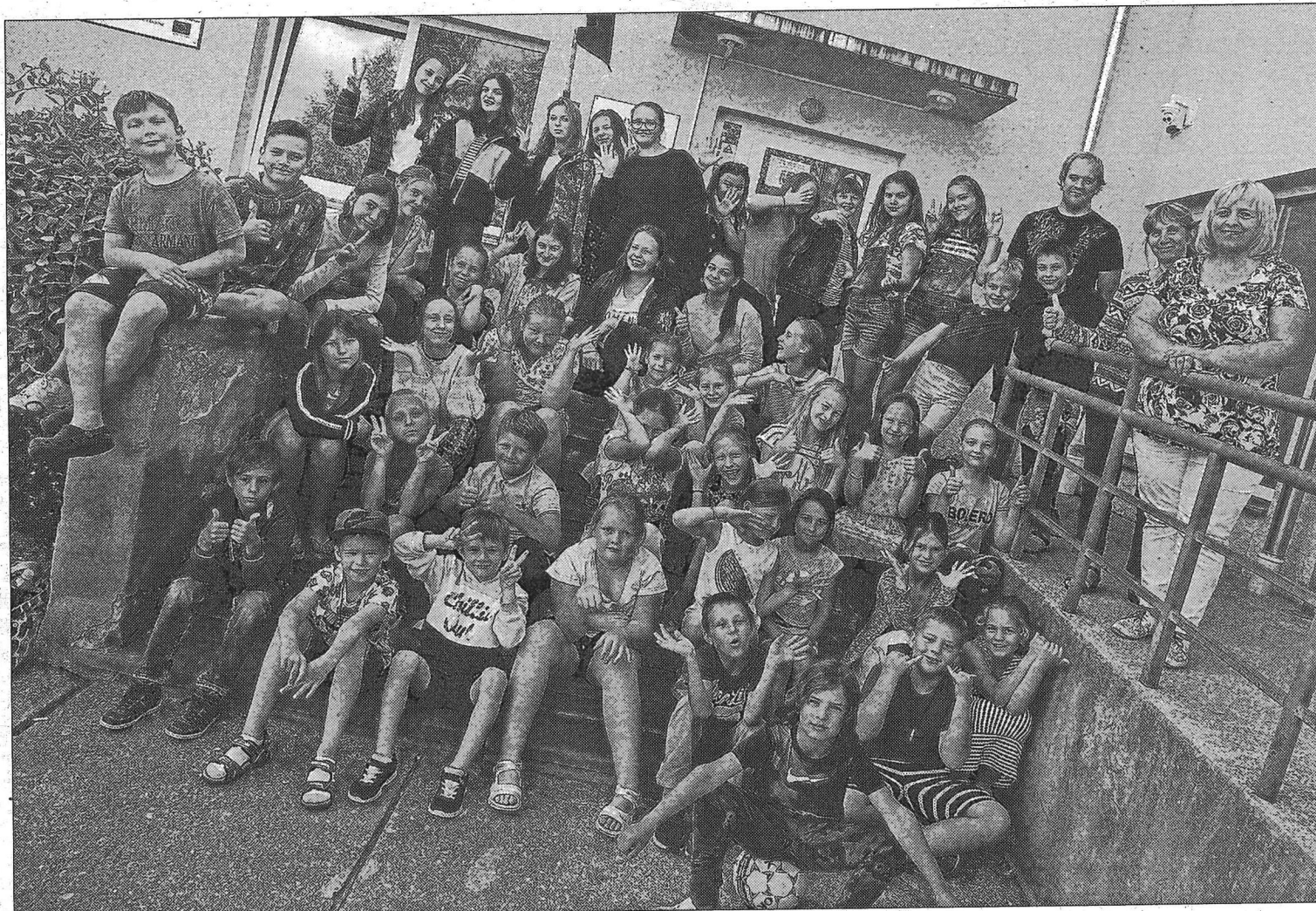
Kas var būt labāks par to, kā pēc nogurdinoša mācību gada atpūties un radoši izpausties nometnē, kur visus vieno kopīga aizraušānās

Ciemojoties «Ezeru» mājās, bērni un jaunieši varēja iepazīt