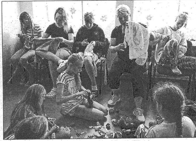
Auduma gabaliņi, diegi, dzijas, šķēres un adatas – pēc aktivitātēm rīmta darbošanās ir īsti vietā