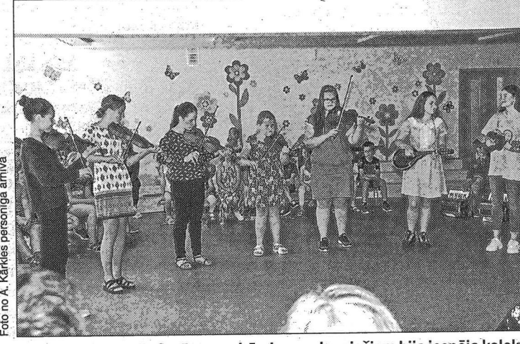
Folkloras nometnē «Garā pupa» bērniem un jauniešiem bija iespēja kolektīvi un individuāli izpausties