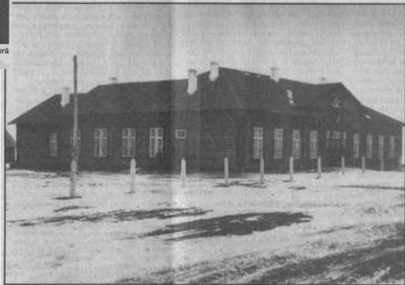
Ildors mācīja bērnus arī Amūras apgabalā izsūtīto latviešu celtajā skolā