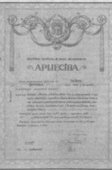
1922.gada apliecība par 3 mēnešu skolotāju kursu beigšanu un Izglītības ministrijas Skolu departamenta 1930.gada apliecība par to, ka Ildors Gercāns ir pilntiesīgs skolotājs