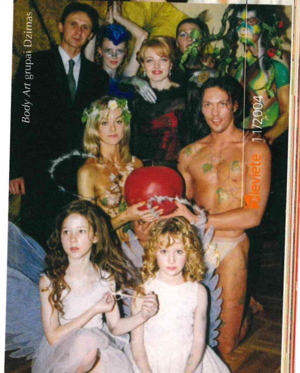
Body Art grupai Dzinmas