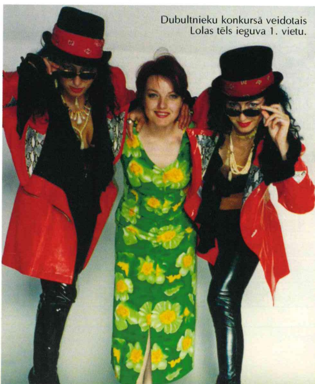
Dubultnieku konkursā veidotais Lolās tēls ieguva 1. vietu.

Man nav kāda konkrēta stila, ko gribētu izcelt. Atkarībā no situācijas varu būt ļoti lietišķa vai sportiska, vai sievišķīgi romantiska. Un jebkurā jūtos labi. Agrāk manā garderobē praktiski nebija bikšu. Valkāju tikai svārkus. Tā kā mana pamatprofesija bija sieviešu kleitu drēbniece, tad garderobe sastāvēja tikai no pašas šūtām lietām – smalkām blūzītēm līdz pat virsjakām un mēteljiem. Šuvu ne tikai sev un ģimenei, bet arī lielam daudzumam klientu. Vairākus gadus nostrādāju "Rīgas Modēs", kur varēju smelties idejas un izveidot stilīgas lietišķas. Tagad situācija ir mainījusies. Laika trūkuma dēļ vairs nešuju. Vienīgi ar vakartērpiem esmu palikusi uzticīga sev. Tos