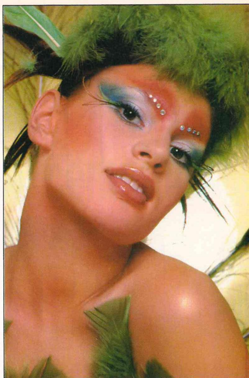
Kaut arī LADYBIRD angliški ir «māriete», stiliste likusi viņai iejusties putna tēlā.

dzintars, Chilly – kā čili pipariņš. Stiliste lēš, ka skatuves vārdu neizvēlas nejauši un tam ir arī sava saistība ar cilvēka rakstura īpašībām.