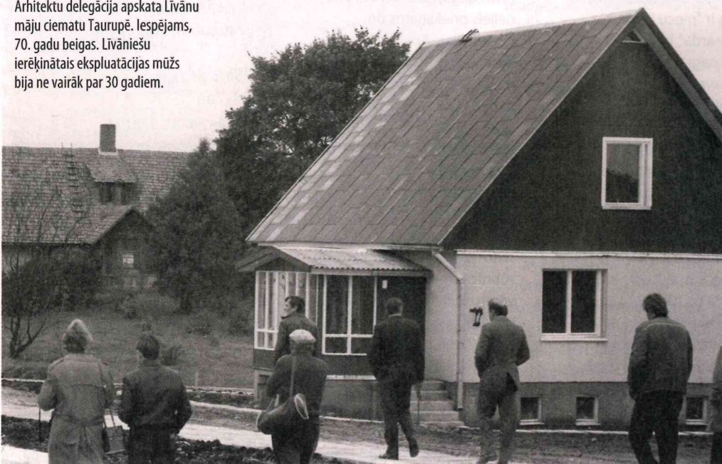
Arhitektu delegācija apskata Līvānu māju ciematu Taurupē. Iespējams, 70. gadu beigās. Līvāniešu ierēķinātais ekspluatācijas mūžs bija ne vairāk par 30 gadiem.

vieta vajadzēja būt koka brusām! Tā arī bija lielākā kļūda," stāsta arhitekts. Savukārt paneļu konstrukcijas pildījuma akmens vate nav bijusi tik kvalitatīva kā mūsdienās un pēc kāda laika sasēdusies. Ja ēkas stūri nebija kvalitatīvi savienoti un aizpildīti