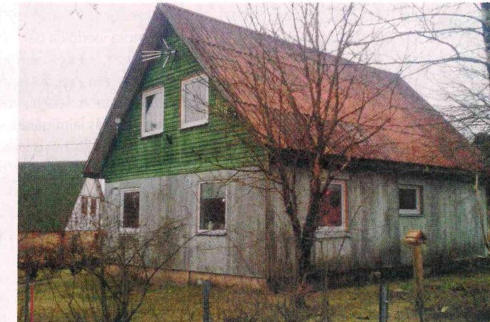
Nepārveidotas līvānietes Latvijā ir retums. Bet ir. "Līvānu māja "5M" – pilnā godībā un pie pilnas veselības kā no rūpnīcas, ar betona skursteni un plakano azbestcements apšuvumu. Bildēts 2017. gadā Kurzemē," šo foto komentē A. Zavadskis

1987. gadā laukos stāvēja ap 500 māju, kas gan bija samontētas, taču ne pilnībā iekārtotas. Tās stāvēja tukšas, bojājās, tika pamazām izzagtas (par to 1988. gada 5. martā rakstīja "Lauku Avīze").