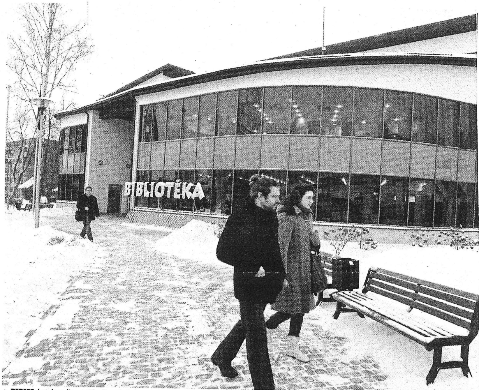
▲ PIRMS desmit gadiem reti kurš varēja iedomāties, ka Līvānos būs viena no modernākajām bibliotēkām Latvijā ar automatizēto grāmatu katalogu. Bibliotēku novērtējuši arī jaunie līvānieši, kas studē Rīgā.