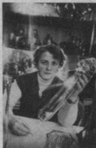
dājums, kam līdz gada beigām tāks kļāt vēl seki.

Fabrikas kolektīvs, kas vairākkārt uzvarējis Vissavienības un republikas sociālistiskajā sacensībā, letur kursu uz pastāvīgu sortimenta mainīšanu, jaunu izstrādājumu paraugu otru ieviešanu, produkcijas kvalitātes uzlabošanu. Cieši kontakti nodibināti ar tirdzniecības organizācijām. Tiek rīkotas fabrikas izstrādājumu pārdošanas izstādes un pircēju konferences, kuru laikā līvānieši uzzina no pašiem pircējiem, kas viņiem patīban ir vajadzīgs. Piec gades pēdējā gada desmit mēnešos vien apgūts 21 jauns izstrā-