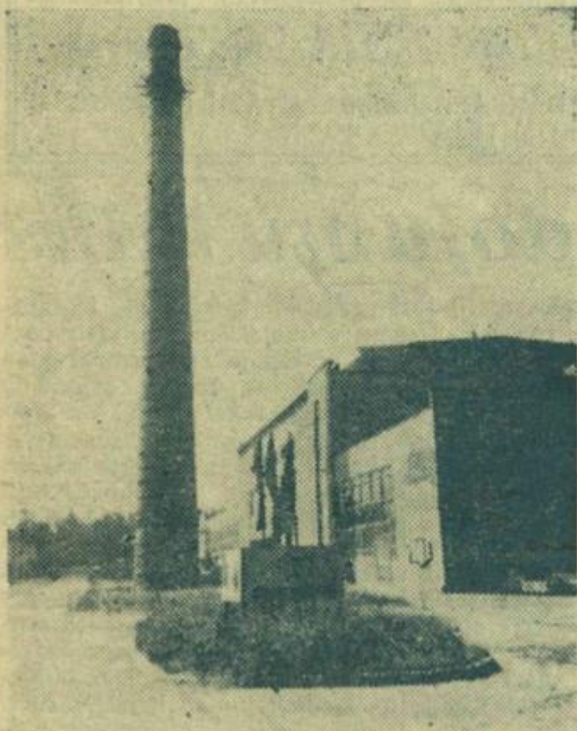
Pēc rekonstrukcijas Livānu stikla fabrikas jauda pieaugusi vairāk nekā divarpus reizes.