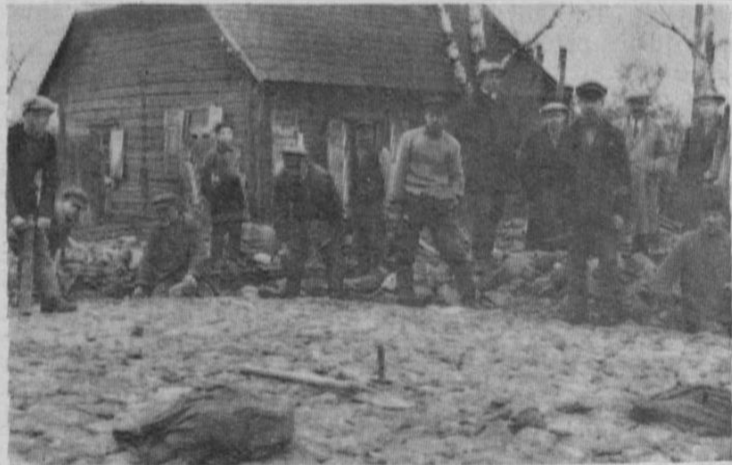
Tāda bija Rīgas iela 1928. gadā.