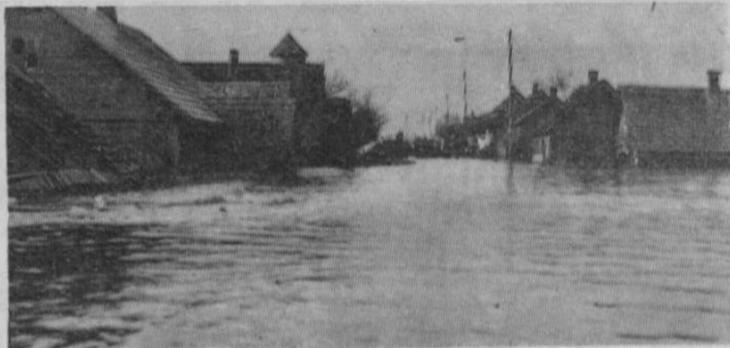
Līvāni plūdos 1931. gada 1. maijā.