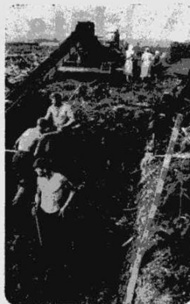
Brūnā, saulē nodegušie stāvi met kūdras mašīnas elevatorā.