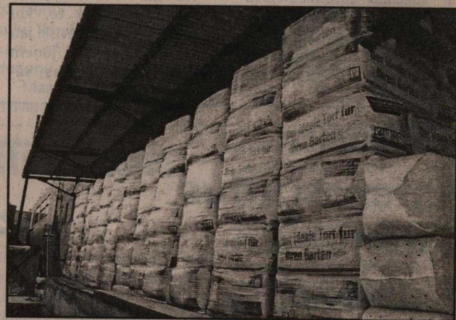
Pircēji pieprasa, lai kūdra būtu salikta viņu iepakojumā, tādēļ uz līvāniešu sagatavotās kūdras neatrast uzrakstu «Made in Latvia».

Lai attīstītu ražošanu, Līvānu kūdras fabrika plāno tuvāko gadu laikā pārorientēt valējās kūdras transportēšanu uz ostu no auto-transporta uz dzelzceļa izmantošanu. Tas būtu lētāk, taču prasa lielus ieguldījumus — Līvānu dzelzceļa stacijā jāizbūvē laukums kūdras iekraušanai. Tuvāko 4—5 gadu laikā ir mērķis attīstīt pakojanas un pārstrādes posmu tiktāl, lai kūdras substrātus varētu ražot Līvānos. Tāpat plānots palielināt kūdras ieguvu, jo teritorija un resursi