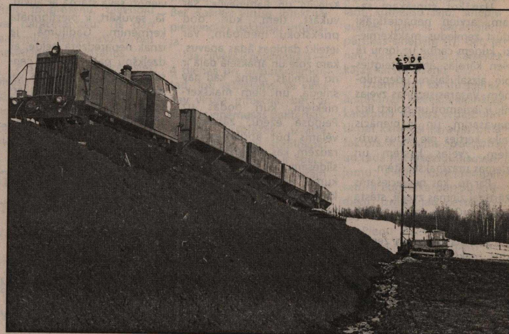
No purva kūdru atved pa šaursliežu dzelzceļu. To izkrauj, izsijā un daļa pa frakcijām.