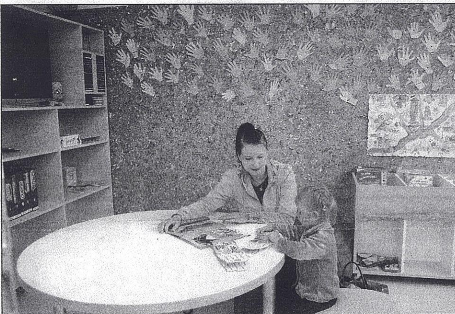
● Cik labi iegrimt pasaku istabas mikstajos pufos un kopā ar māmiņu aplūkot krāsainās grāmatīnas, ar kurām var arī spēlēties.