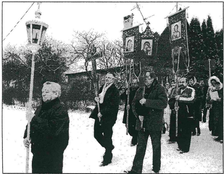
● Livānu pareizticīgo baznīcas draudze Krusta gājienā uz Dubnu.