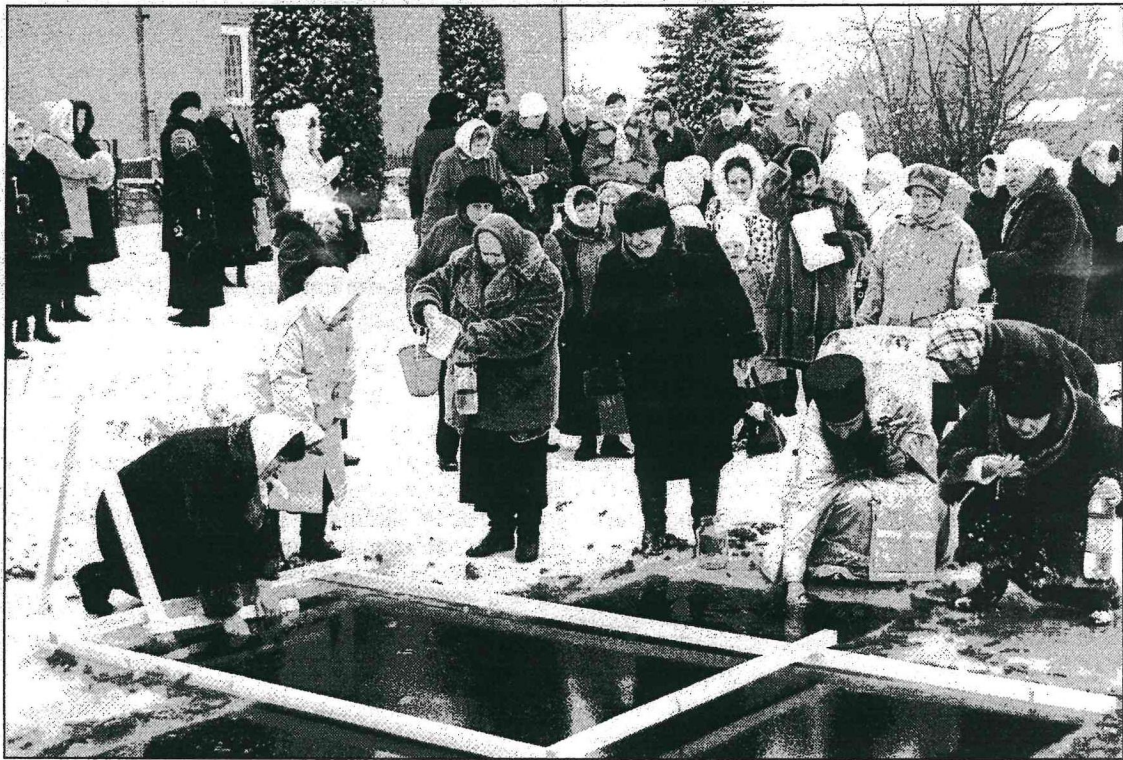
● Pareizticīgie piepilda traukus ar jordānas — Dubnā izcirsta āliņģa nosvētīto ūdeni.